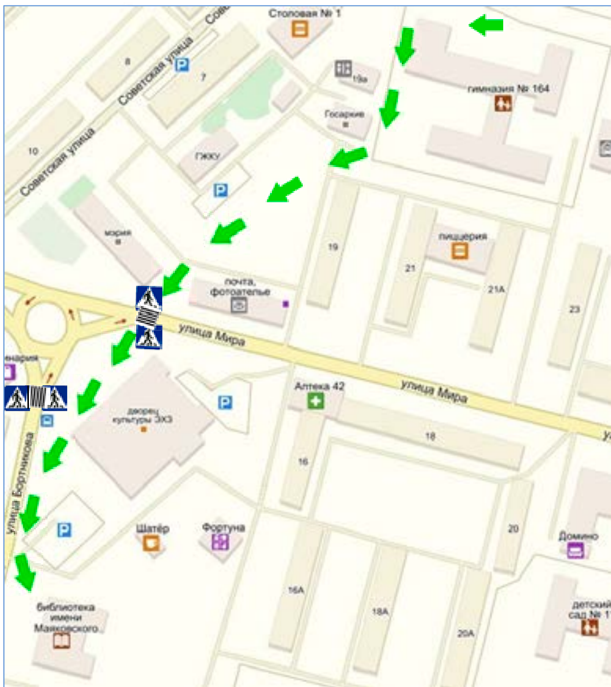
Схема безопасного маршрута движения организованных групп детей к местам проведения занятий (городская библиотека им. В. Маяковского, городской Дворец культуры)