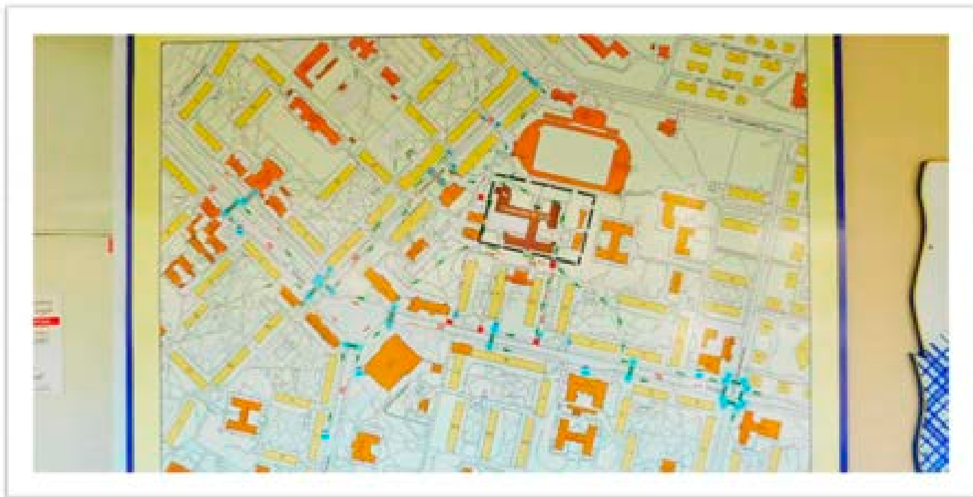
Измененный фрагмент схемы

Фотография размещенной схемы организации дорожного движения в непосредственной близости от МБОУ «Гимназия №164» с размещением соответствующих технических средств организации дорожного движения, маршруты движения детей и расположения парковочных мест