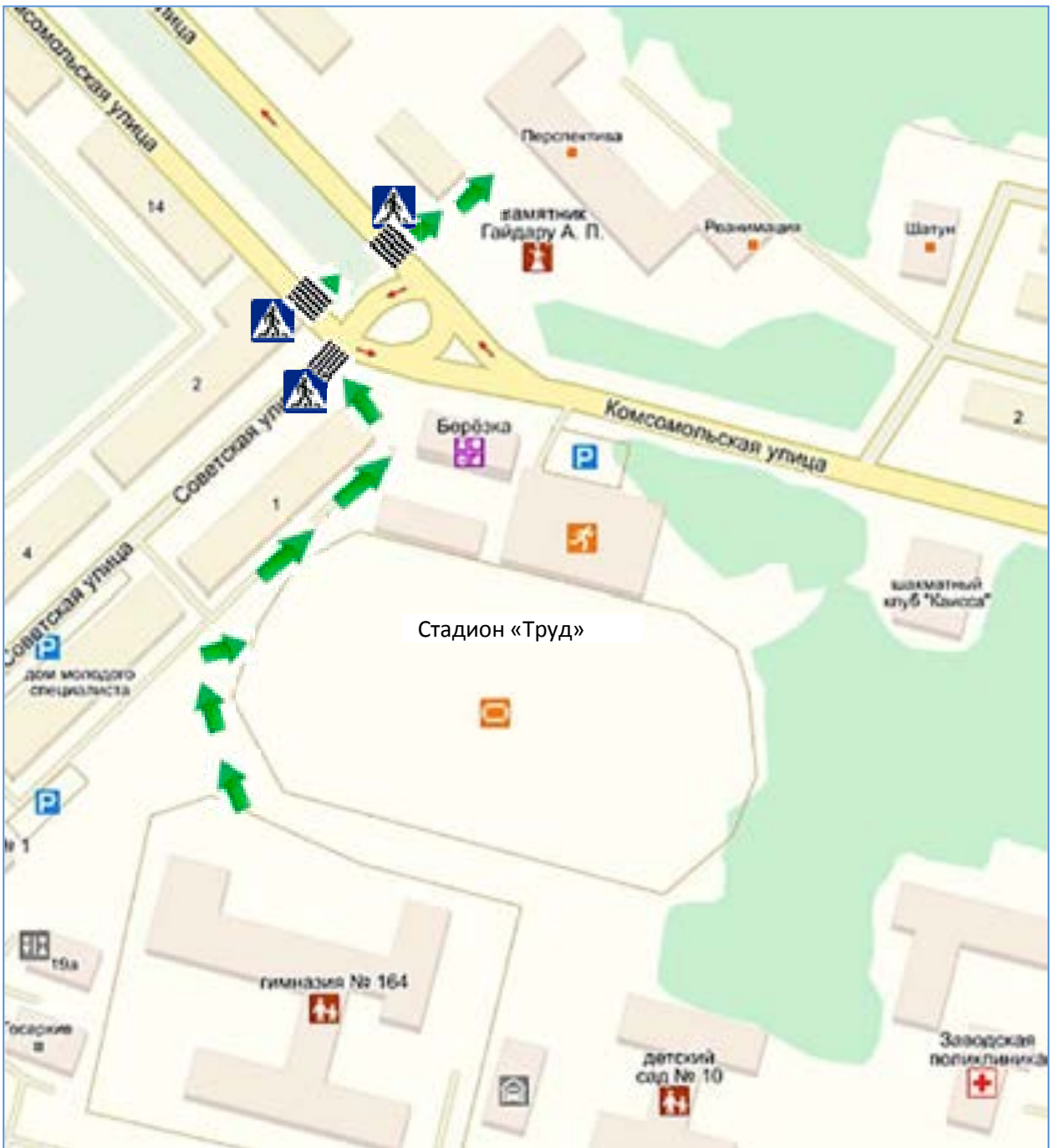
Схема безопасного маршрута движения организованных групп детей к местам проведения занятий (стадион, учреждение дополнительного образования «Перспектива»)